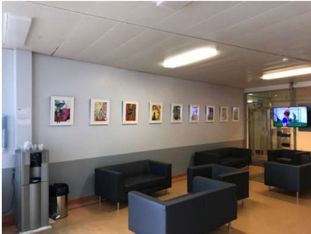
Ariane Wyss, espace détente, bâtiment Stern