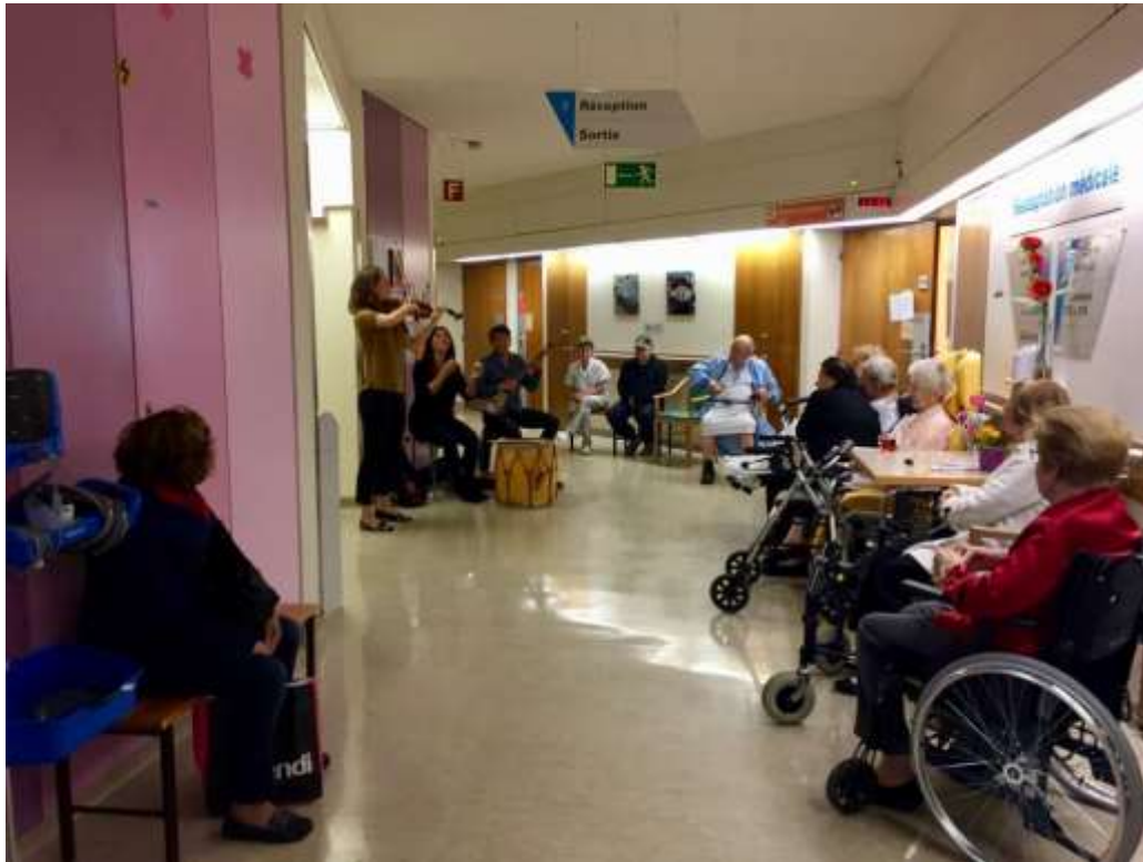
Barlovento Trio, Bellerive