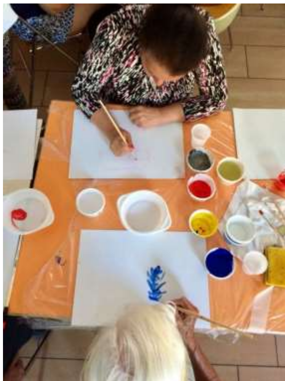
Résidence d'artiste, Belle-idée