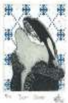
Véronique Merlini Chargée de projets / musique

Affaires culturelles des HUG - www.arthug.ch 2, chemin du Petit Bel-Air - 1226 Thônex +41 22 305 41 44