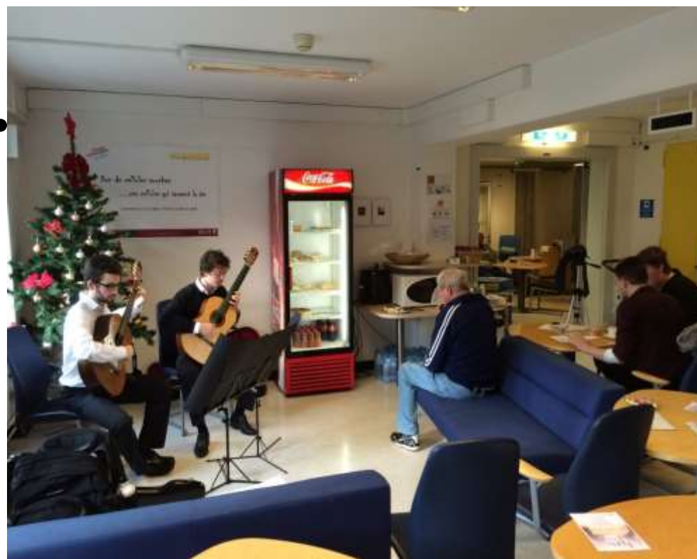
Centre de transfusion sanguine