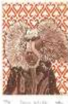
Camille Dols Chargée de projets / communication