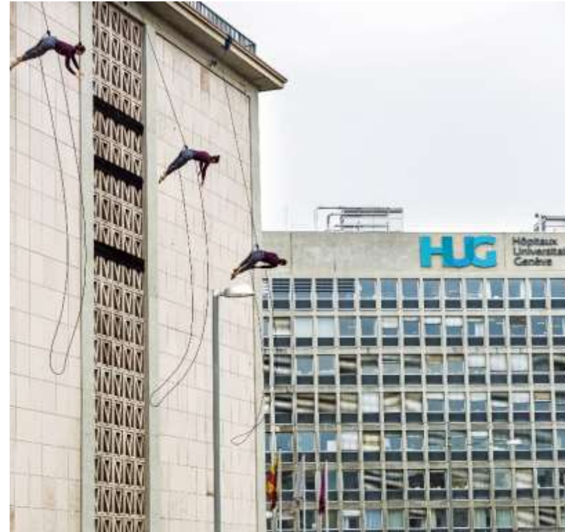
Fête de la danse, hôpital

https://www.youtube.com/watch?v=lqpkRyRMkpQ