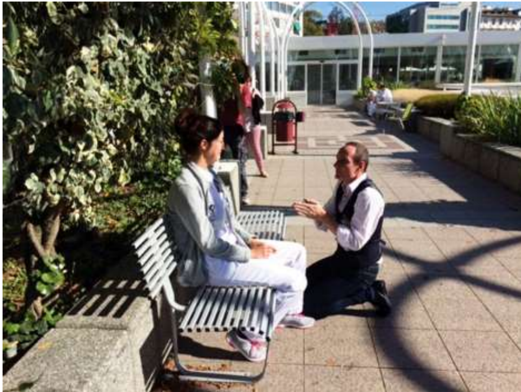
Fête du Théâtre, hôpital

https://www.youtube.com/watch?v=lqpkRyRMkpQ