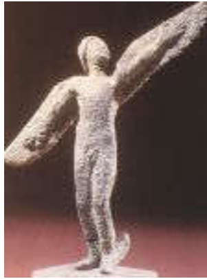
ABB. 1 (PP Vortragstitel)